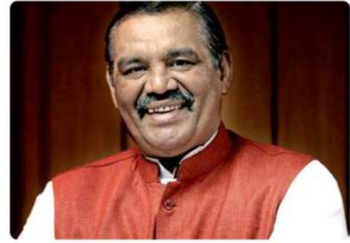
श्री विजय सांपला अध्यक्ष

राष्ट्रीय अनुसूचित जाति आयोग द्वारा प्रकाशित मासिक पत्रिका के 22वें अंक के लिए संदेश लिखते हुए मुझे अपार प्रसन्नता हो रही है। बीते 14 अप्रैल को बाबा साहेब डॉ. भीम राव अंबेडकर जी की 132वीं जयंती का आयोजन नई दिल्ली स्थित आयोग मुख्यालय में किया।