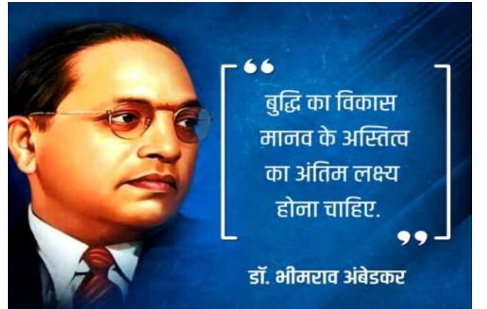
डॉ. भीमराव अंबेडकर