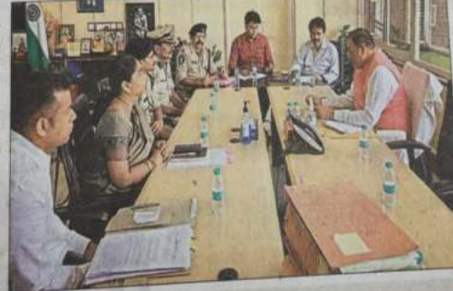
बैठक में भाग लेते हुए गणनाम।